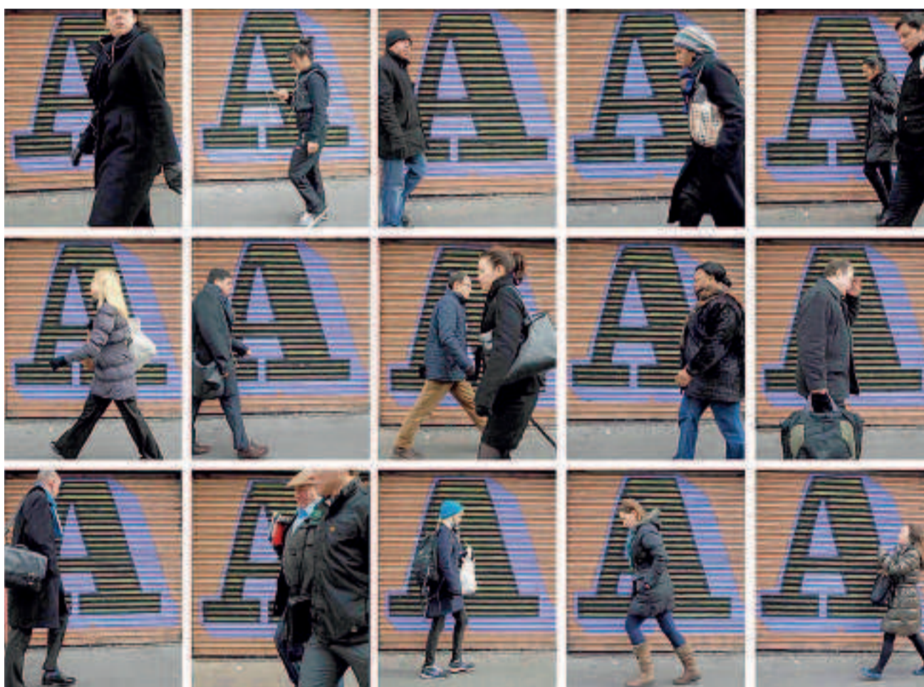
L'Europe, contrairement aux USA, n'a pas imposé la transparence de la méthodologie des agences.

Divers experts s'accordent sur le caractère imparfait des notes de ces agences et la nécessité de réduire leur influence. Mais les solutions sont difficiles à implémenter.